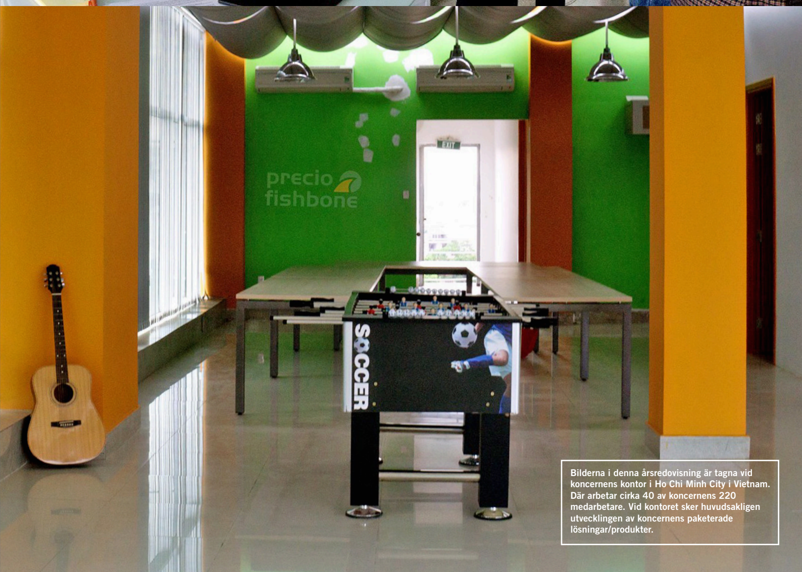
Bilderna i denna årsredovisning är tagna vid koncernens kontor i Ho Chi Minh City i Vietnam. Där arbetar cirka 40 av koncernens 220 medarbetare. Vid kontoret sker huvudsakligen utvecklingen av koncernens paketerade lösningar/produkter.